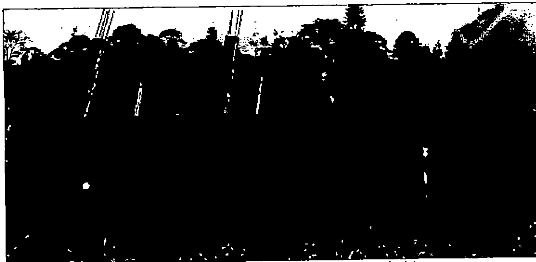
Ilustración 1 Procesos constructivos activos en el predio (1).

En la inspección ocular se observó que en el inmueble propiedad del señor JOHNATHAN BERRIO MUÑOZ identificado con PK No.6312001000000300020 y ficha 18130244, existen procesos constructivos activos. A continuación se presentan algunas fotografías: