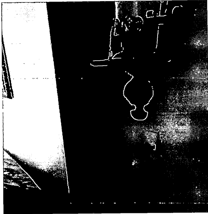
Ilustración 2 Fisuras en muros (2)

Cabe destacar que al momento de la visita, no se evidenciaron grietas ni fisuras en los elementos estructurales del pórtico del edificio que puedan comprometer la estabilidad estructural del mismo y pongan en riesgo la vida e integridad de las personas que en el habitan, es de aclarar que este informe es producto de una inspección ocular para el día de la visita y no genera responsabilidad por eventos que puedan presentarse a futuro.