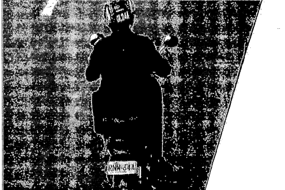
Código del Equipo: 2012534002 Identificación del Equipo: VLS-50173 Organismo de Tránsito: STT Sabaneta

Dirección: Avenida Las Vegas por Calle 60 Norte-Sur Carril: 2/3 Fecha: 19/04/2013 Hora: 11h13min48s Tiempo desde cambio a Rojo: 48s Tiempo Sobre Carril: 24s No.Imagen: 352956 Tipo de Infacción: No respetar el paso de peatones que cruzan una vía en sitio permitido para ellos