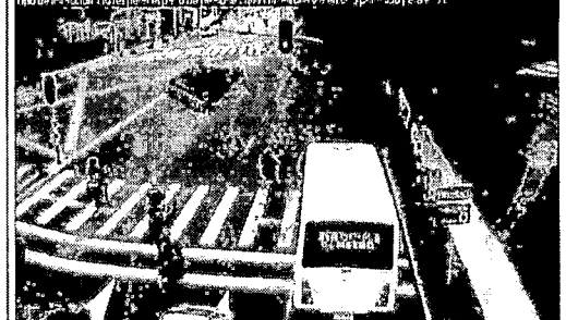
Código del Equipo: 2012534002 Identificación del Equipo: VLS-50173 Organismo de Tránsito: STT Sabaneta

Dirección: Avenida Las Vegas por Calle 60 Norte-Sur Carril: 2/3 Fecha: 19/04/2013 Hora: 11h14min31s Tiempo desde cambio a Rojo: 48s Tiempo Sobre Carril: 24s No.Imagen: 352956 Tipo de Infacción: No respetar el paso de peatones que cruzan una vía en sitio permitido para ellos